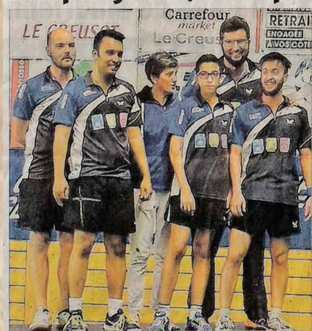
Article Dauphiné-Libéré, mai 2016