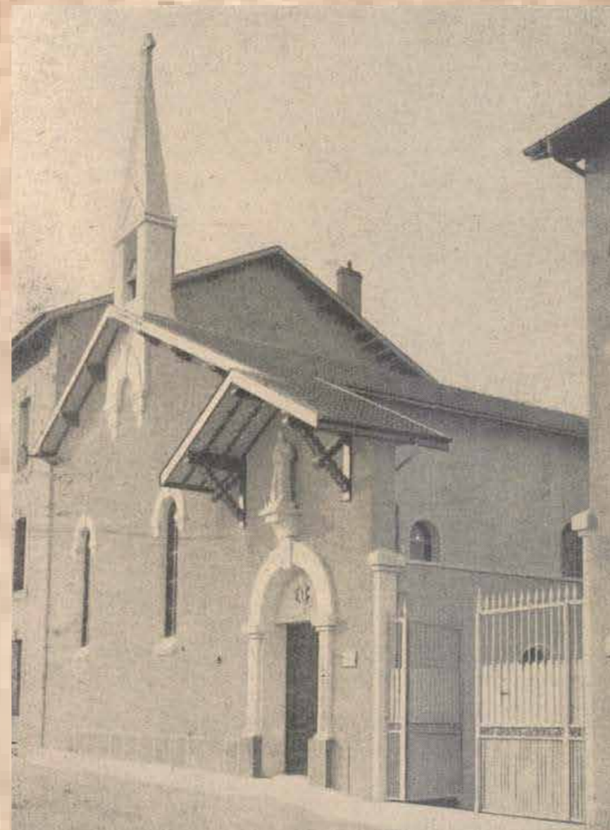
La chapelle du PSH et son entrée sur la rue Bouvet