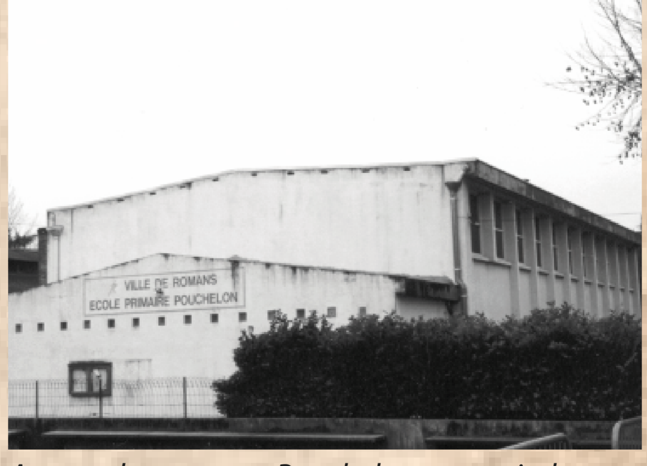
Aperçu du gymnase Pouchelon, construit dans les années 1960

A noter à son palmarès : finaliste de la coupe de France en 1953, champion de France UFOLEP en 1955, champion de France de deuxième division sous les couleurs de La Voultre.