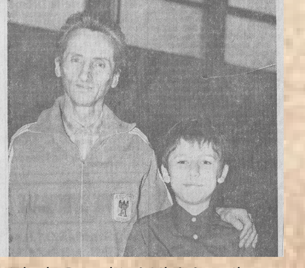
Article du Dauphiné-Libéré, avril 1972