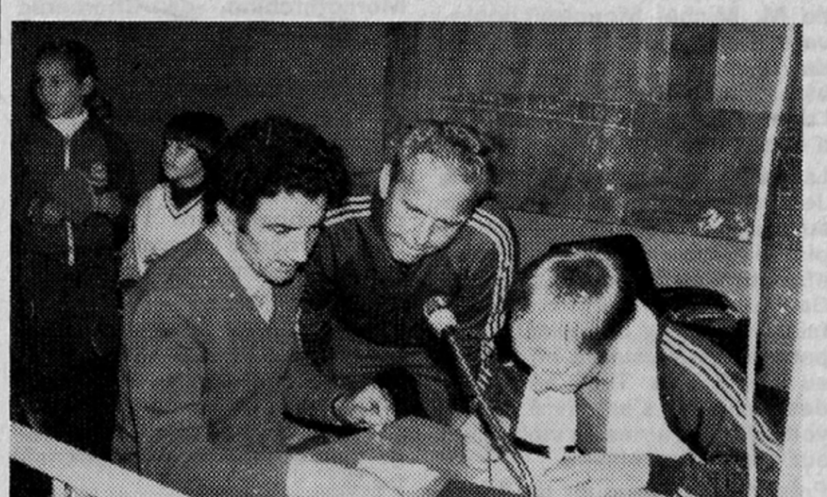
Article du Dauphiné-Libéré, octobre 1980 - Principe du tournoi: un joueur classé fait équipe avec un joueur invité. La 1 ère édition attire 65 équipes!

Bien belle initiative que celle des animateurs des sections tennis de table de l'ASPTT, et du Cercle action et amitié qui ont organisé, vendredi au gymnase Marius-Mout de sympathique relais pongistes. Il s'agissait à l'occasion d'une journée nationale de tennis de table et à travers une manifestation originale d'assurer une bonne promotion à une discipline sportive peut être suivie avec suffisamment d'attention par le grand public. Ainsi, en proposant des relais composés d'un joueur licencié et d'un élément invité, les dynamiques dirigeants du C.A.A. et de l'ASPTT, ont en quelque sorte montré le chemin qui sépare le ping-pong du... tennis de table! Bonne occasion en tout cas pour les personnes invitées à tomber la veste et à pousser la petite balle de cellulose, pour la plupart