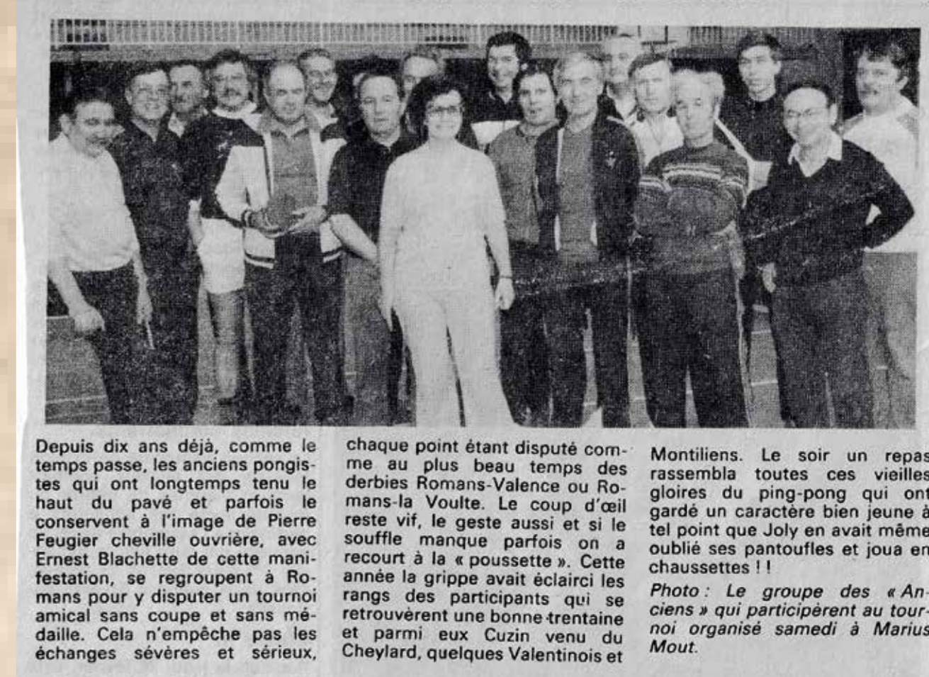
Article du Dauphiné-Libéré, février 1981